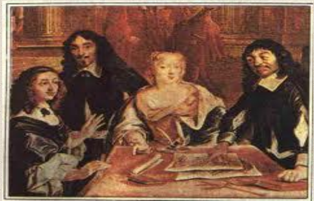
Renato Descartes y su alumna la princesa Cristina de Suecia