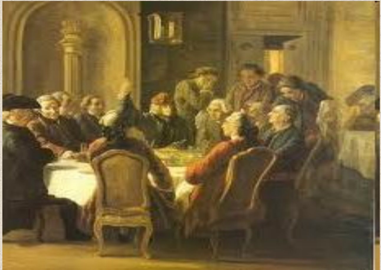
Paris. Tertulia de Ilustrados